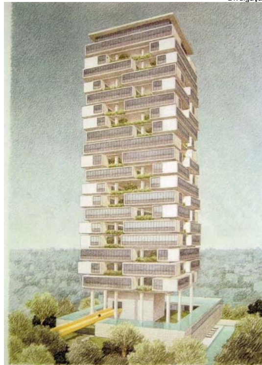
Imóvel conta com apartamentos de dois, três e quatro dormitórios que partem de R$ 500 mil

A Stan Desenvolvimento Imobiliário lança neste mês o empreendimento que vai inovar o conceito de morar em São Paulo, o Edifício 360°. Criado pelo arquiteto mais conceituado e premiado do país, Isay Weinfeld, o projeto tem como objetivo realizar o sonho de quem procura um apartamento com design e vista privilegiada com quintal e conforto igual ao de uma casa.